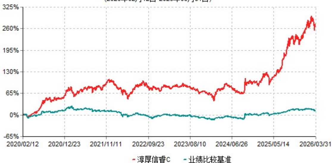
淳厚信睿C累计净值增长率与业绩比较基准收益率历史走势对比图 (2020年02月12日-2026年03月31日)

注：本基金基金合同生效日为 2020 年 2 月 12 日。按基金合同约定，本基金自基金合同生效起 6 个月内为建仓期。建仓期结束时本基金的各项投资比例均符合基金合同约定。