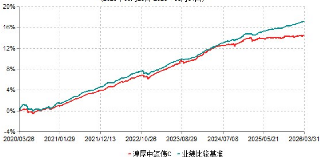
淳厚中短债C累计净值增长率与业绩比较基准收益率历史走势对比图 (2020年03月26日-2026年03月31日)

注：本基金基金合同生效日为 2020 年 3 月 26 日。按基金合同约定，本基金自基金合同生效起 6 个月内为建仓期。建仓期结束时本基金的各项投资比例均符合基金合同约定。