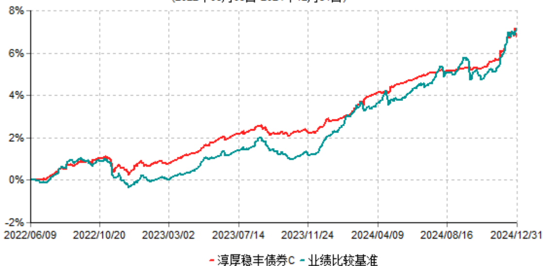
淳厚稳丰债券C累计净值增长率与业绩比较基准收益率历史走势对比图 (2022年06月09日-2024年12月31日)

注：本基金基金合同生效日为 2022 年 06 月 09 日。按基金合同规定，本基金自基金合同生效起 6 个月内为建仓期。建仓期结束时本基金的各项投资比例均符合基金合同约定。