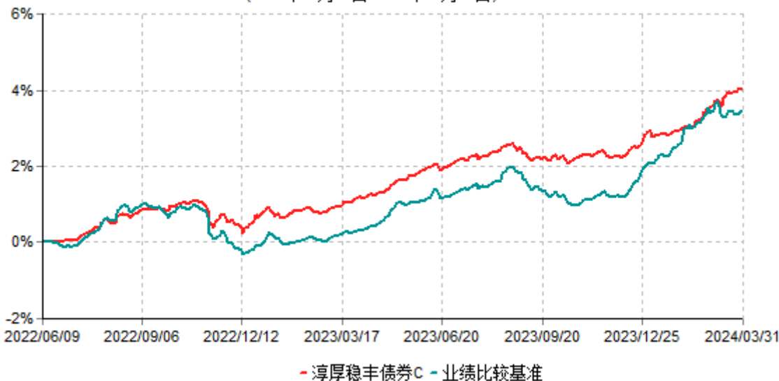
淳厚稳丰债券C累计净值增长率与业绩比较基准收益率历史走势对比图 (2022年06月09日-2024年03月31日)

注：本基金基金合同生效日为 2022 年 06 月 09 日。按基金合同规定，本基金自基金合同生效起 6 个月内为建仓期。建仓期结束时本基金的各项投资比例均符合基金合同约定。